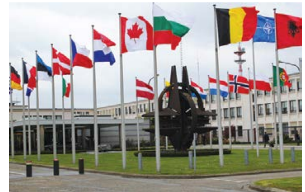
Штаб-квартира НАТО в Брюсселе

Под словом «процветание» они понимают приватизацию, распродажу государственного имущества: приход в эту страну транснациональные корпорации и скупка ими всего и вся.