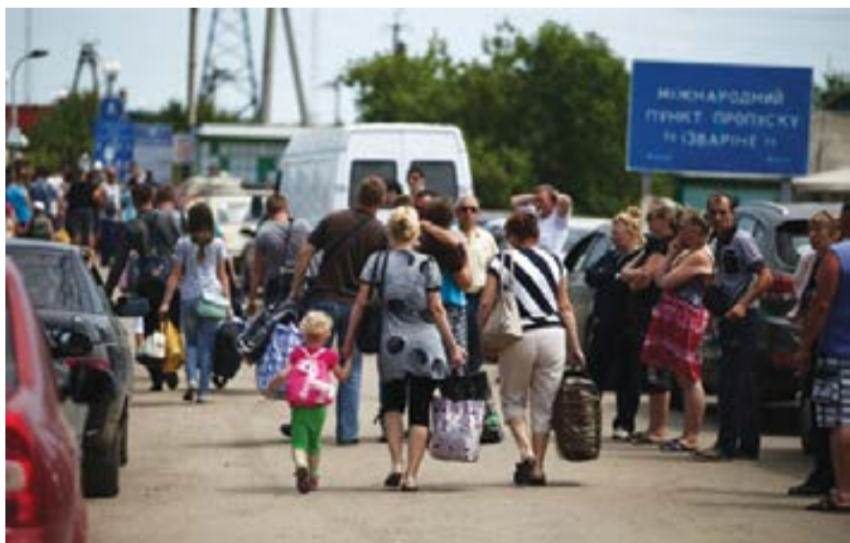
Международный пункт пропуска «Изварино», Донецк

(1) Ввести санкции, если вооружённые силы Российской Федерации не будут выведены из Крыма. Президент США налагает санкции на любое должностное лицо или агента Российской Федерации, любого близкого к нему сотрудника или члена семьи, должностного лица Правительства Российской Федерации. Список определяется и контролируется Президентом США.