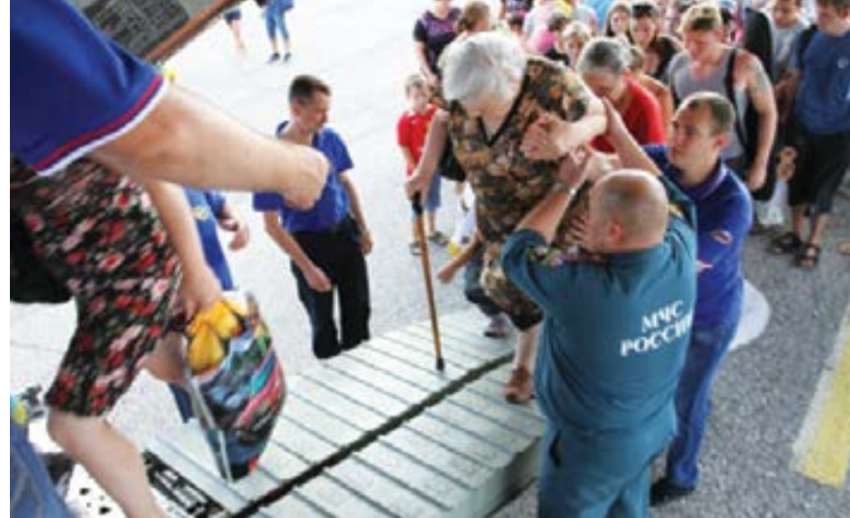
Поток беженцев из Украины в Россию

(С) любой близкий соратник высокопоставленного российского чиновника.