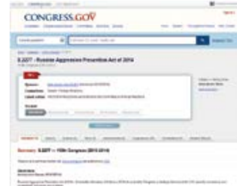
Закон США (BILL) № 2277 «Акт о предотвращении агрессии со стороны России 2014»